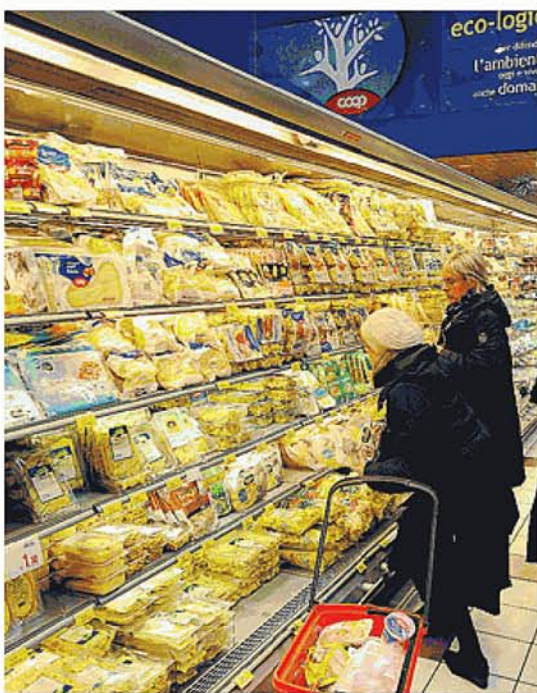
Un supermercato Coop

Monte dei Paschi e dell'ex vicepresidente della banca senese, Francesco Gaetano Caltagirone, per non vendere le azioni del Monte dei Paschi, considerate "strategiche" (che non vuol dire niente ma suona bene). Così adesso le azioni non valgono quasi più niente, ma ogni anno la Coop paga milioni in affitti al Fondo Etrusco, di cui però ha preso delle quote, cosicché partecipa alla speculazione contro se stessa. Le sei cooperative del nord, che han-